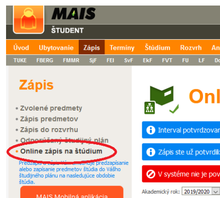
Obr. 2 Obrazovka Zápis na štúdium